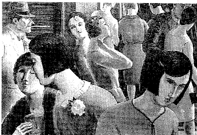
"Les modistes", obra de 1929