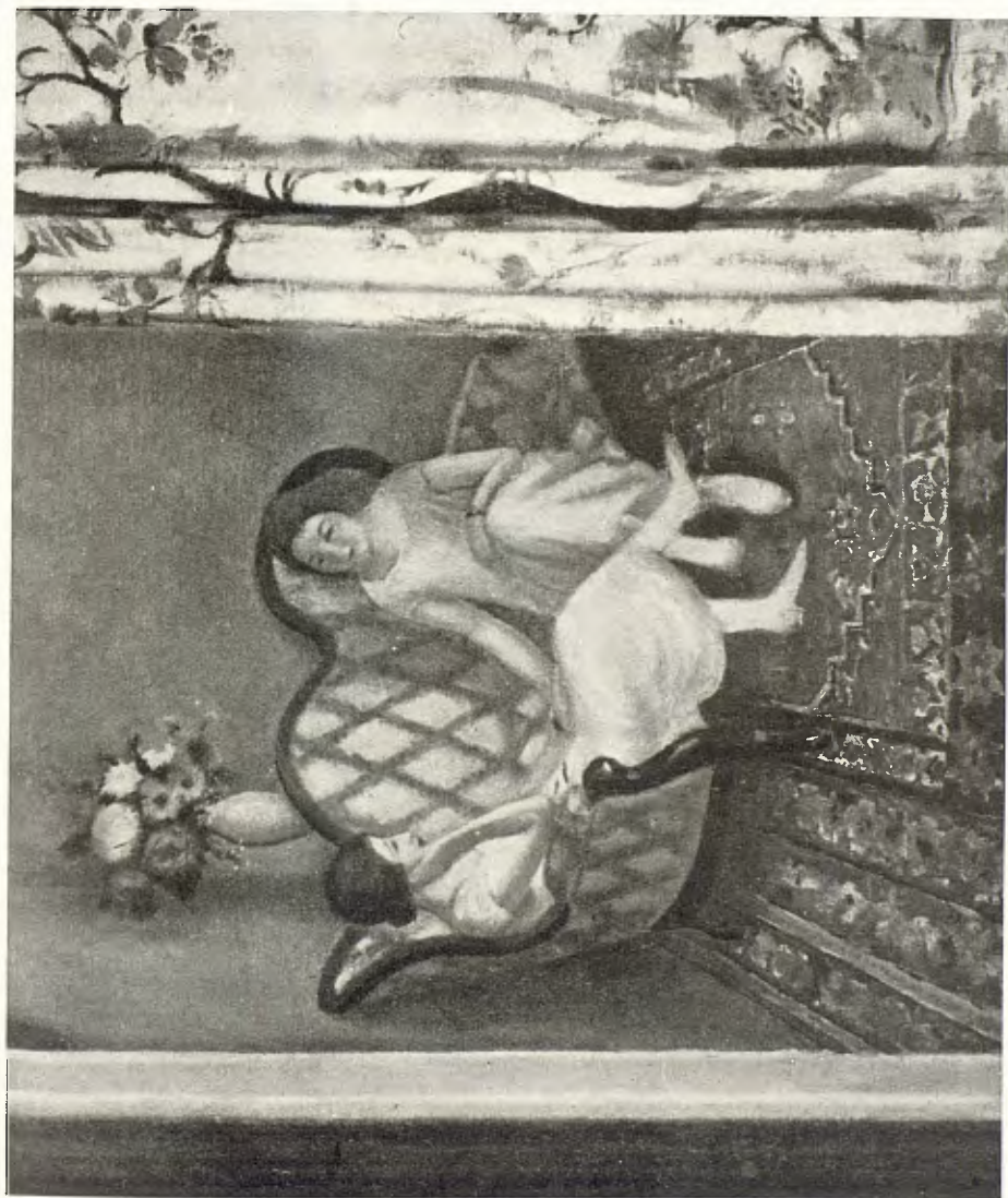
PL. N.º XIII. — M. A. ESPINAL: INTERIOR